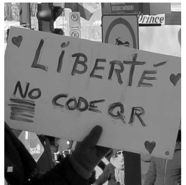
Pendant la manif du 5 février.

en faire des entités rentables. C'est le projet de l'Organisation pour la Coopération et le Développement Économique (OCDE) depuis une quarantaine d'années, dont nous voyons épisodiquement les effets dans la privatisation des services publics qui deviennent des sévices publics, dans la santé (à deux vitesses locale et globalement), dans l'éducation. Il y aura toujours des crises et des luttes à mener, des victoires et des défaites, et des backlash comme l'écrivait Susan Faludi, à propos de la lutte des femmes.