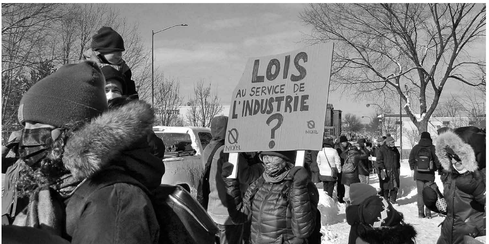
Manifestation contre l'augmentation des normes de nickel à Québec, le 5 février.

Les résidents et résidentes de la basse-ville de Québec ne devraient pas avoir la responsabilité de se battre pour la qualité de leur air. Ce sont les représentants élus qui devraient être dans cette obligation, soit celle de représenter les intérêts et le bien-être de leurs citoyens. La pollution atmosphérique est pourtant l'enjeu de santé publique du siècle selon l'OMS. La CAQ ne semble pas prendre la pleine mesure du problème, alors que plus de sept millions d'individus meurent à chaque année suite à des problèmes respiratoires. Le gouvernement du Québec, non-élu dans la circonscription de Taschereau et de Jean-Lesage, fait-il preuve de clientélisme en plaçant la santé des citoyens de Limoilou et Maizerets en-dessous des intérêts financiers d'une multinationale qui a largement démontré qu'elle avait une éthique douteuse ? L'avenir nous le dira, mais je vous invite à deviner la réponse. En attendant que cette mauvaise histoire prenne fin, Droit de Parole vous invite à suivre la Table citoyenne Littoral Est sur Facebook, qui proposera d'ici peu des assemblées de cocreation au courant du mois de février et de mars, afin de combler le fossé du vertigineux manque d'imagination de nos politiciens, dans la question comment concevoir le territoire ? La ressource économique ne doit plus être une réponse.