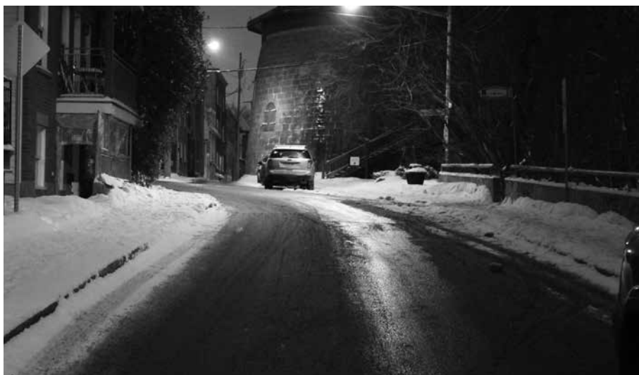
Sur la rue Laviguer.