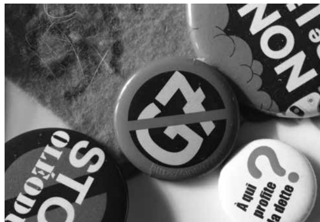
Macaron du G7