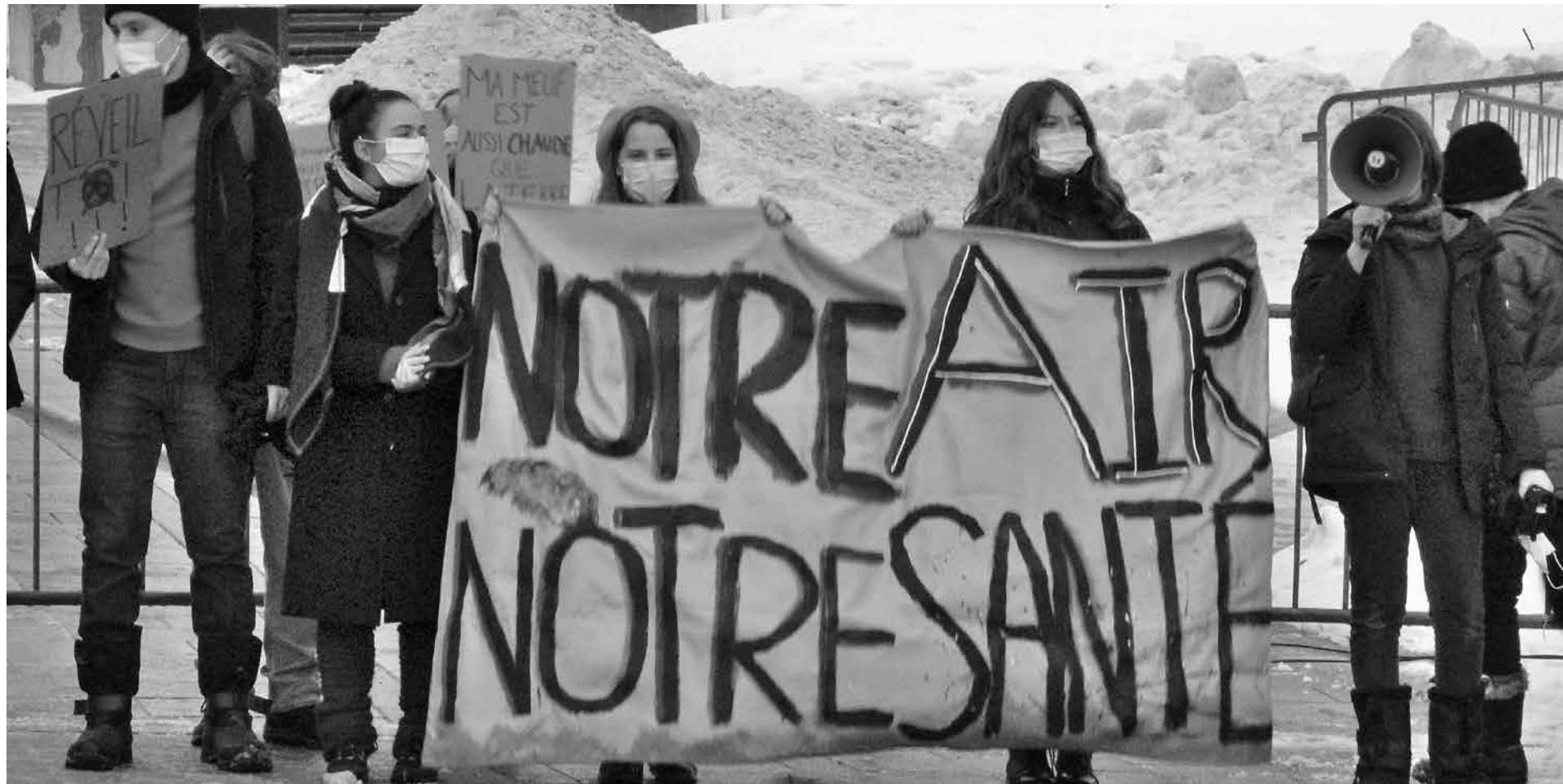
Manif contre la hausse de nickel, le 10 février 2022 devant l'Assemblée Nationale.