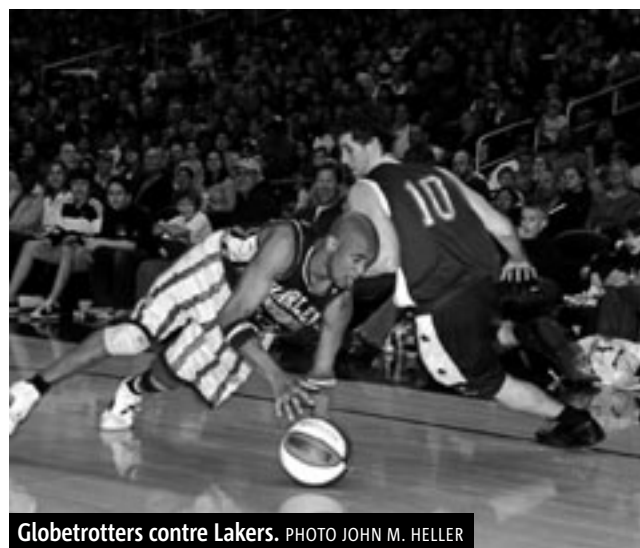
Globetrotters contre Lakers.

Les Globetrotters ne font plus leurs gags quand le tableau d'affichage le permet, mais plutôt quand la mise en scène l'a prévu. J'avais parfois l'impression que l'autre équipe se laissait faire et ne faisait pas assez d'effort. On était loin de la fameuse game opposant les Globetrotters aux Lakers (équipe majoritairement formée de blancs)