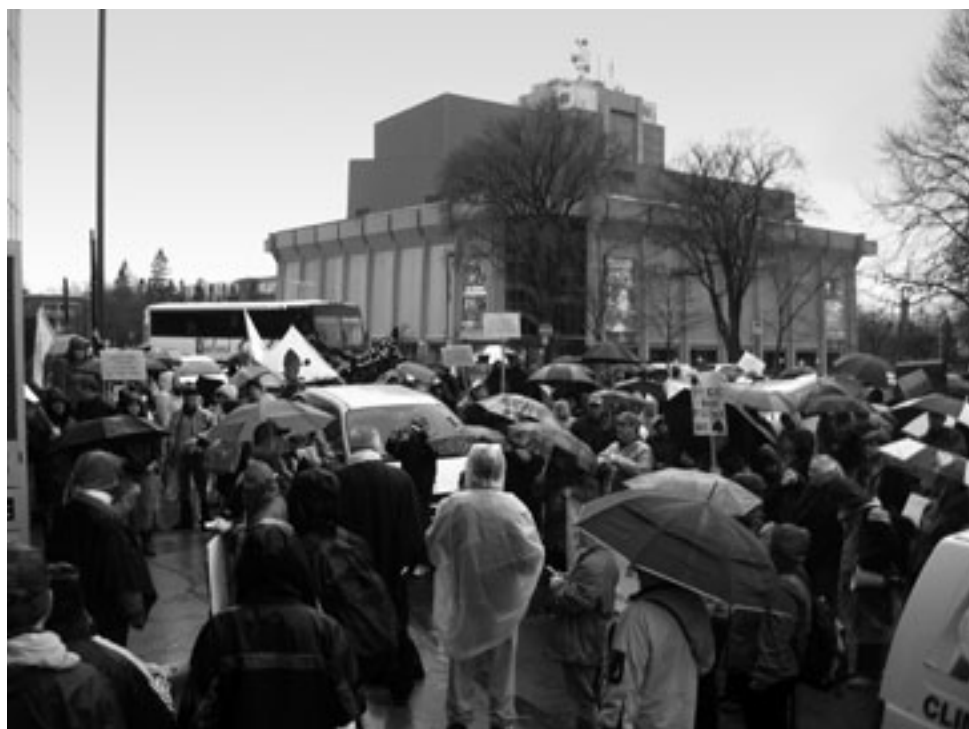
Le 4 mai, devant les bureaux de la ministre Julie Boulet, rue St-Amable. PHOTO DROIT DE PAROLE.

Pour dénoncer ces situations, une couple de centaines de personnes ont marché jusqu'au bureau de la ministre Julie Boulet, le 4 mai, Journée nationale de la Semaine de la dignité des personnes assistées sociales, à l'appel du Front commun des personnes