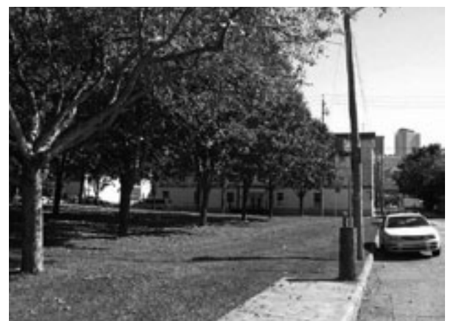
Parc John-Munn. PHOTO JOSÉ DORÉ 2010.

Au programme : présentation de l'histoire navale du parc, construction de navires avec les enfants, ateliers d'aménagement