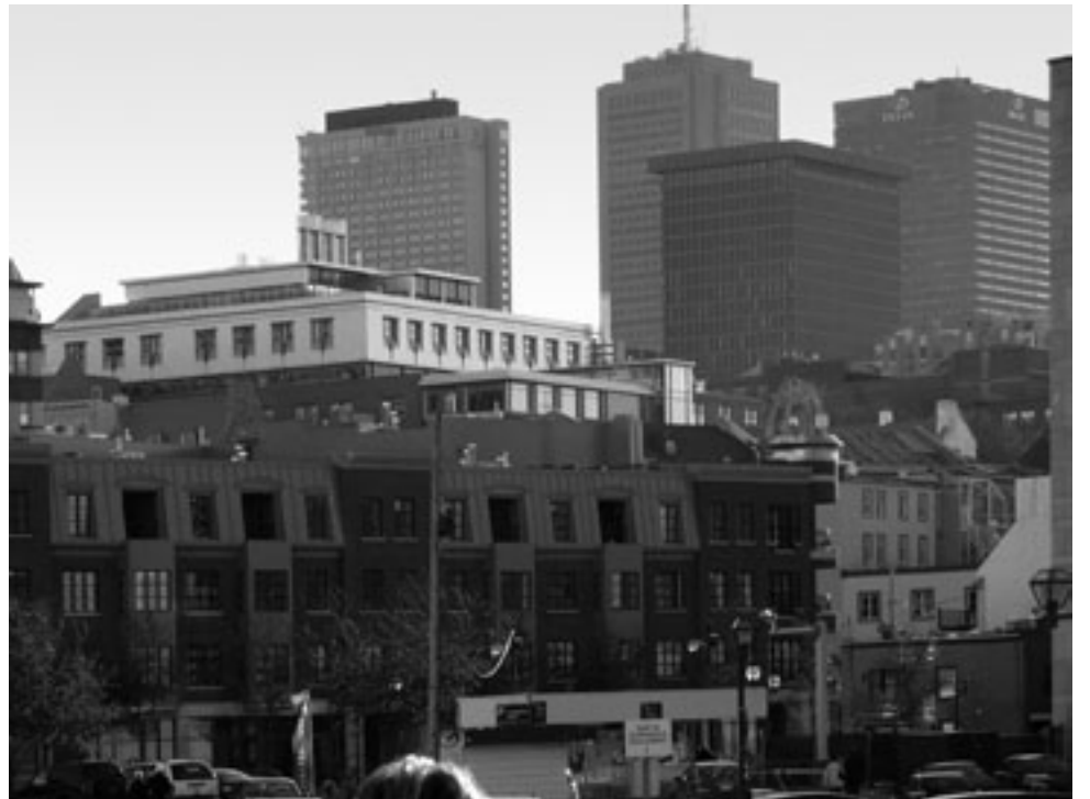
Vue du centre-ville prise du bassin Louise, 2009.

Actuellement, un enjeu majeur du quartier St-Roch est la gentrification. Selon Wikipédia, la gentrification (de gentry , «petite noblesse» en anglais) est un phénomène urbain d'embourgeoisement. C'est le processus par lequel le profil économique et social des habitants d'un quartier se transforme au profit exclusif d'une couche sociale supérieure. Or, cette problématique est gardée sous silence au sein de l'EnGrEnAgE.