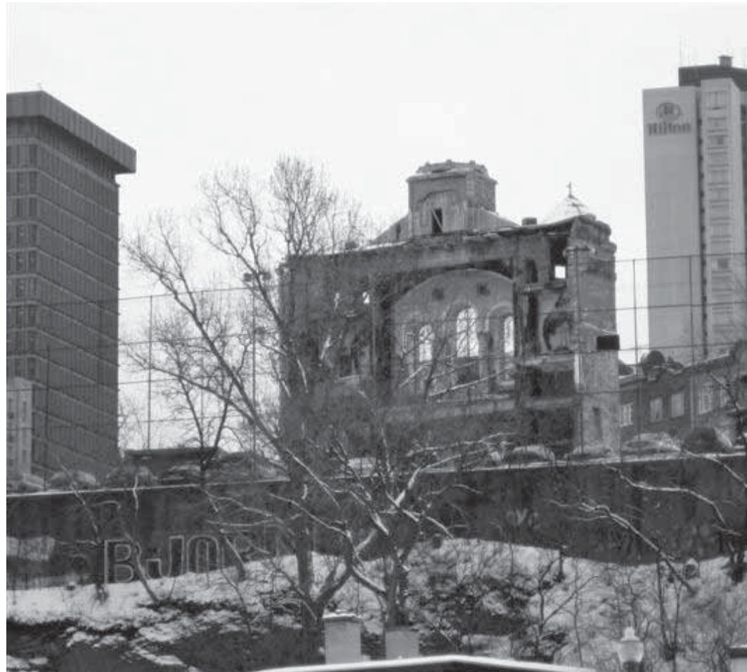
Patro St-Vincent-de-Paul, derrière la façade, janvier 2010

Depuis l'élection municipale, il semble que Madame Saint-Pierre soit devenue l'amie de M. Labeaume. Et, la popularité de son nouvel ami lui ayant ramolli l'épine dorsale, toutes les fanfaronnades de Madame (avant l'élection) sont parties à vau-l'eau. Le nouveau message de la ministre à la ville et au promoteur : faites ce que vous voulez de la façade, du site et, pourquoi pas, du patrimoine.